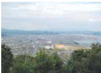
白銀坂(第2休憩所から見た景色)

白銀坂は、始良町から旧吉田町まで約3kmの石畳の残る旧街道で、歴史国道の選定をうけました。